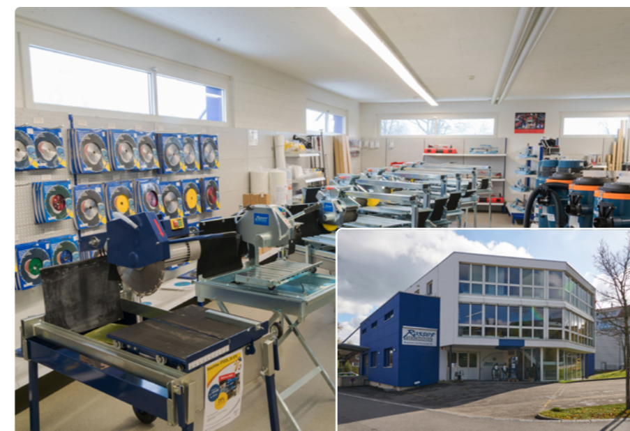
Auch das Ladengeschäft am Hauptsitz von Rosset Technik ist in das Lösungskonzept von Opacc integriert.